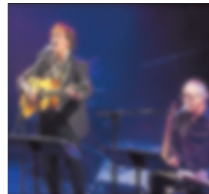
Terra, Riguelle en co.